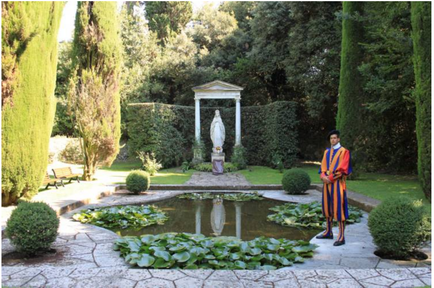
Erneute Aufnahme eines Teils der Vatikanischen Gärten mit der Muttergottes-Statue in Castel Gandolfo.