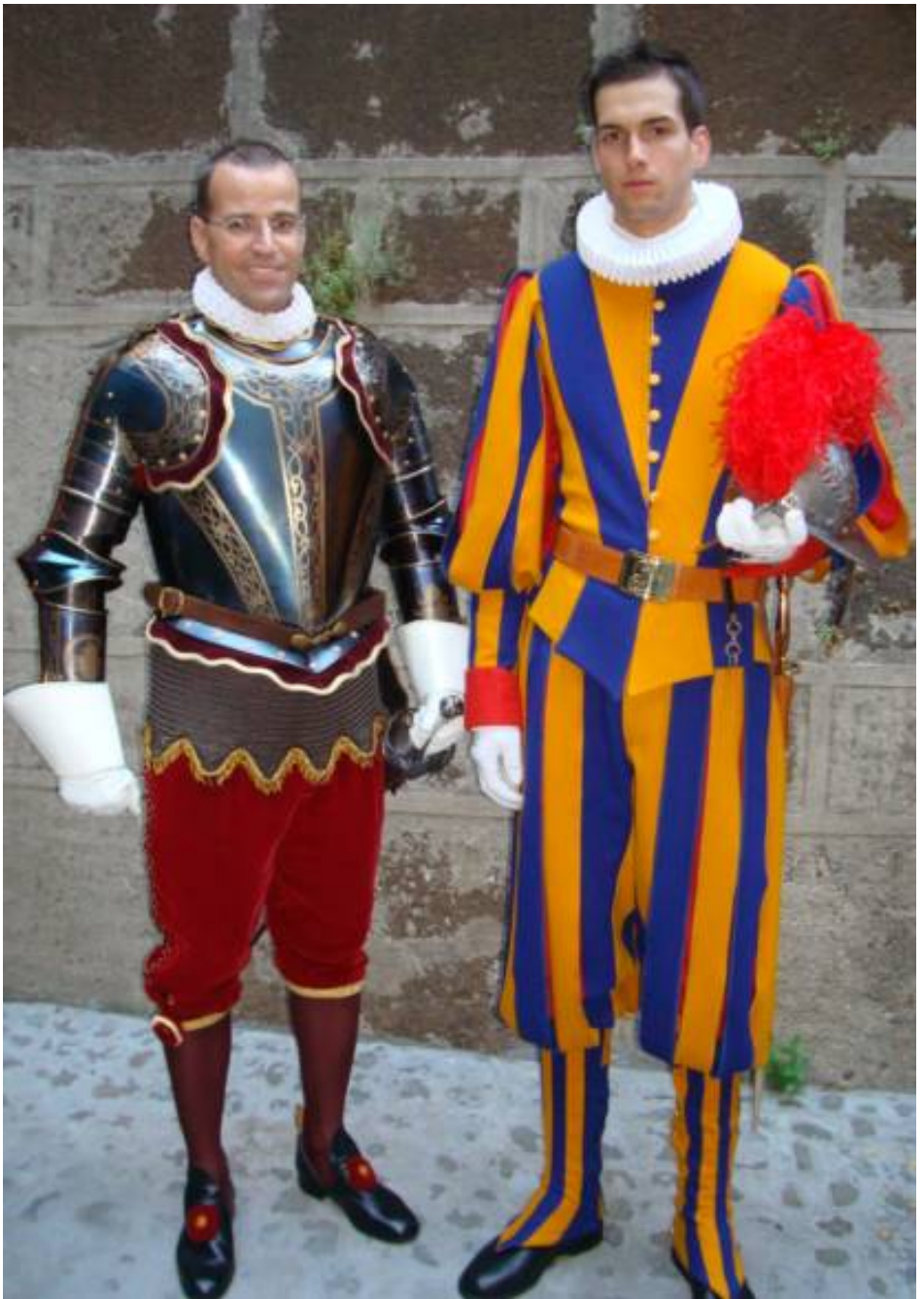
Dario mit Oberst Anrig Daniel (St. Gallen) anlässlich der Vereidigung 2011.