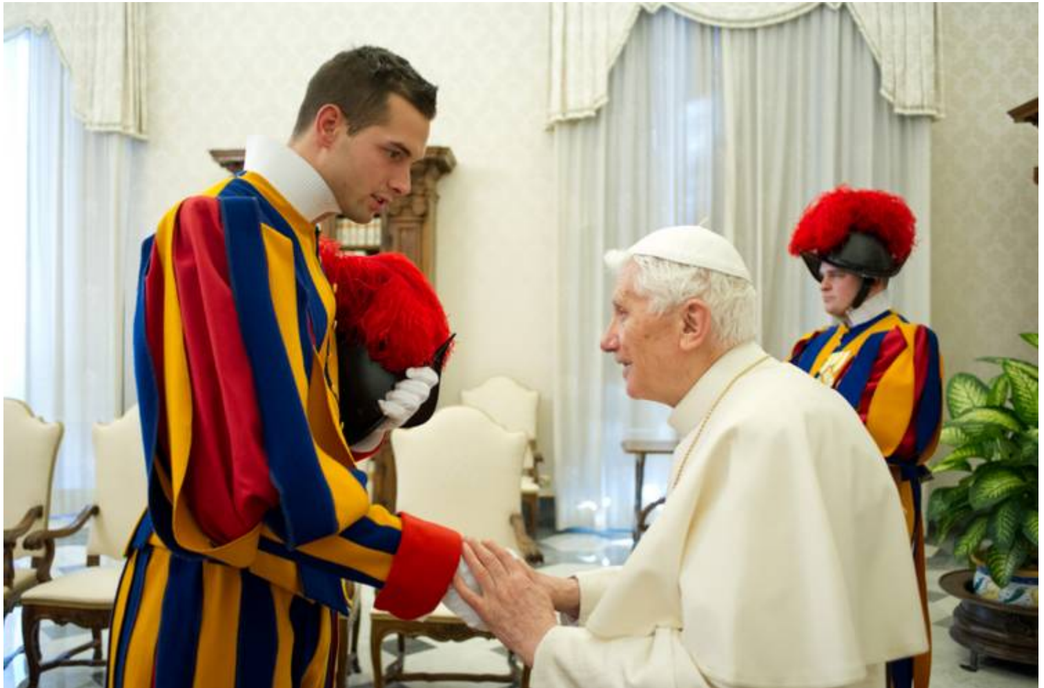
Abschiedsaudienz bei Papst Benedikt XVI. am 16. Februar 2013. Die Audienz fand 12 Tage vor dem Rücktritt Benedikt XVI. statt.