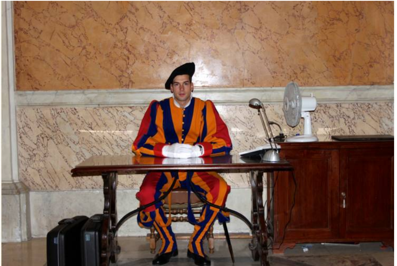
Dienst im Papstpalast.