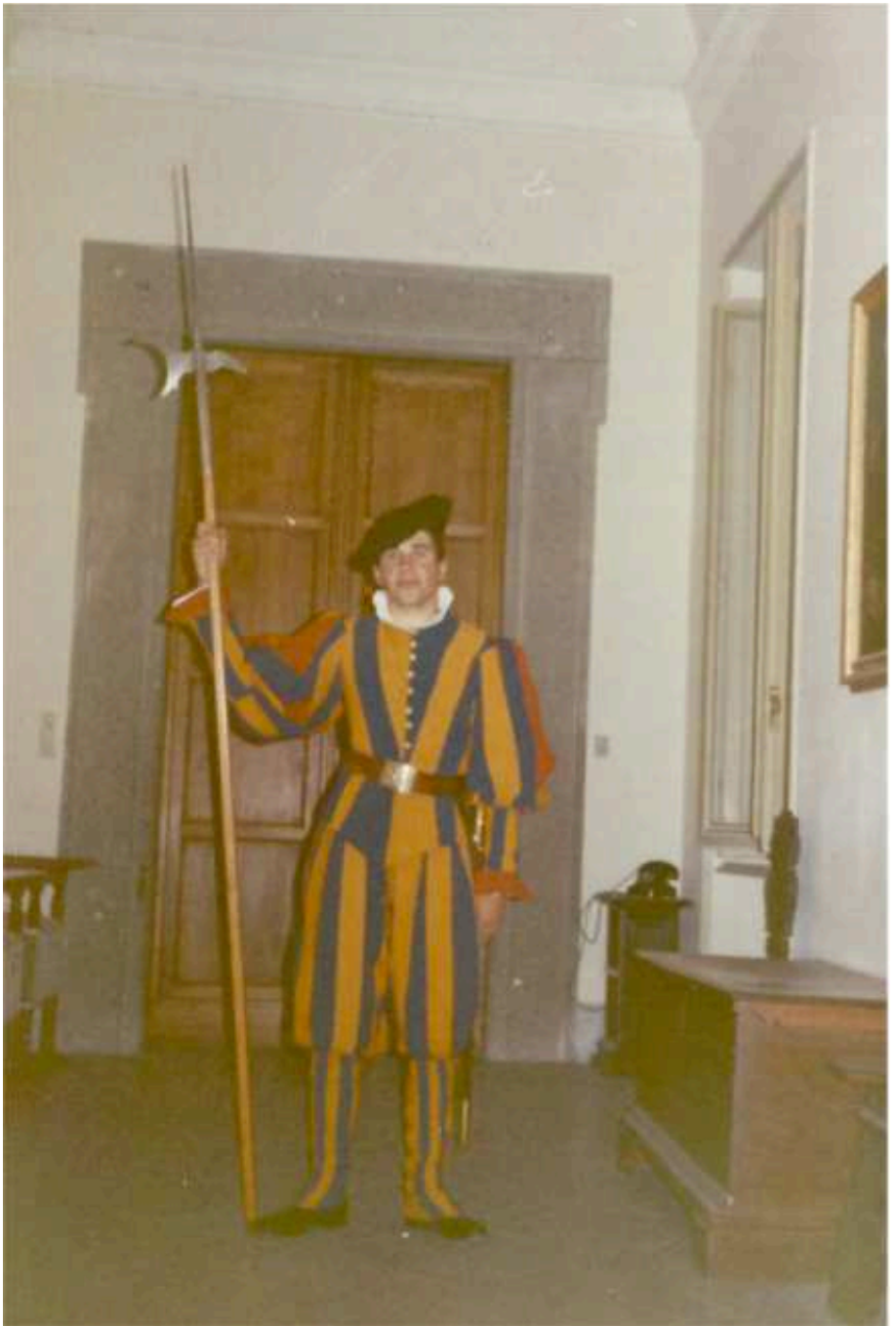
Ebenfalls in Castel Gandolfo.